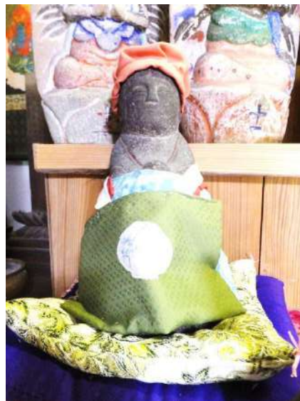
長引野観音堂の弘法大師