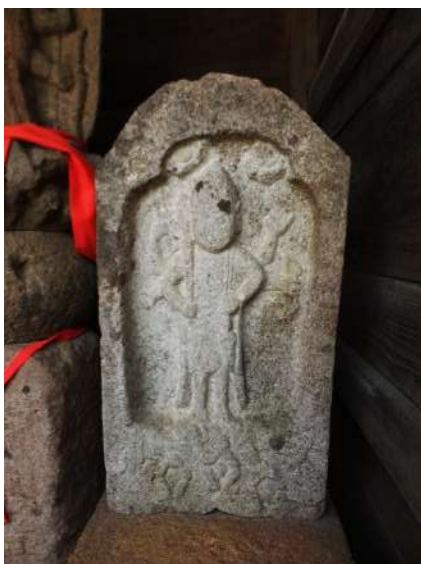
池尻庚申堂の青面金剛