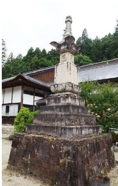
心蓮坊境内の宝篋印塔