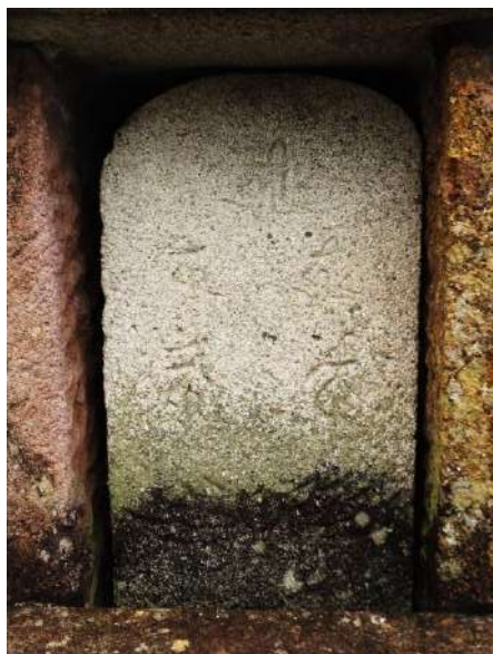
小川寺共同墓地の大威徳明王種子碑