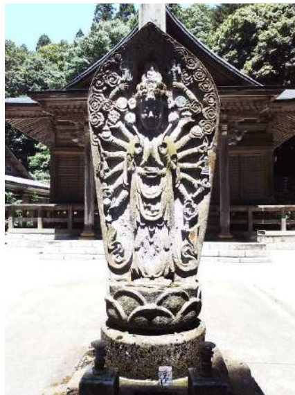
千光寺観音堂と十一面千手観音