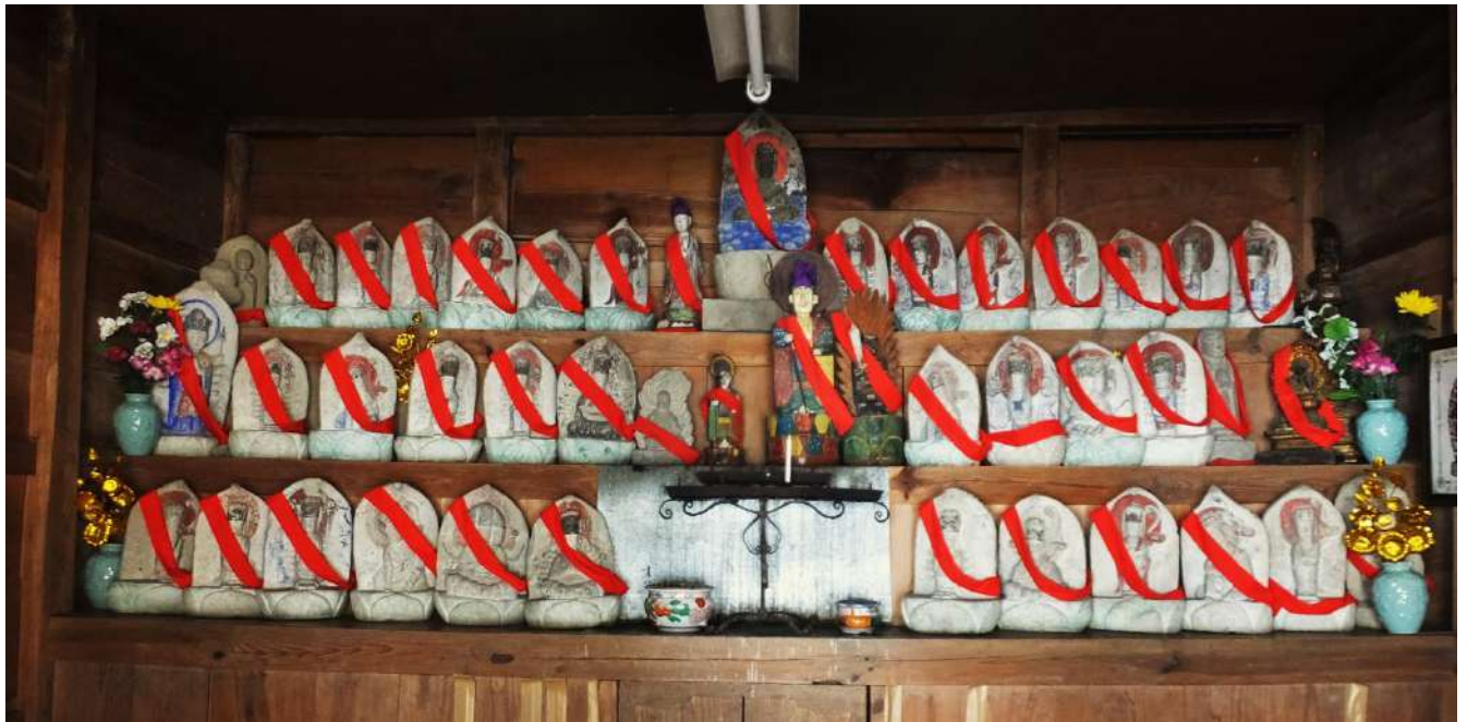
朴谷観音堂の石仏