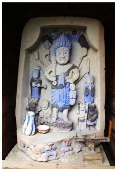
尾山谷川家庚申堂の青面金剛