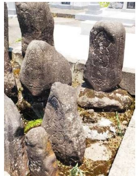
黒沢共同墓地の石塔