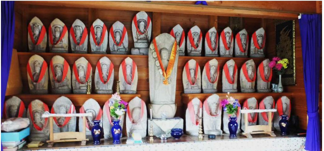
阿弥陀堂観音堂の石仏