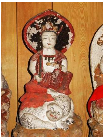
釈迦堂観音堂の文殊菩薩