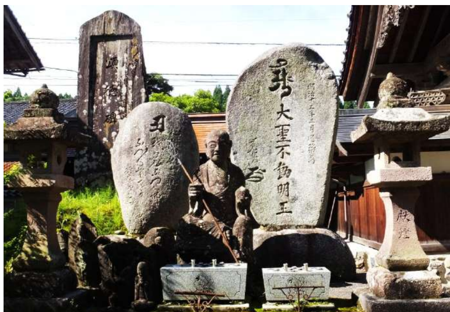
心蓮坊境内の石仏と石塔