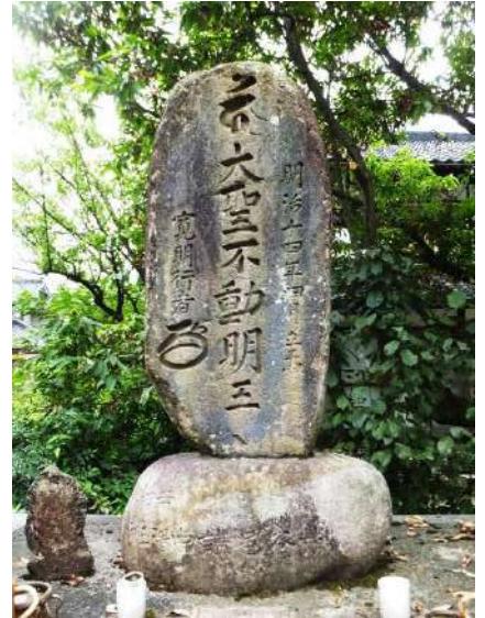
朴谷路傍の「ウーン・大聖不動明王」