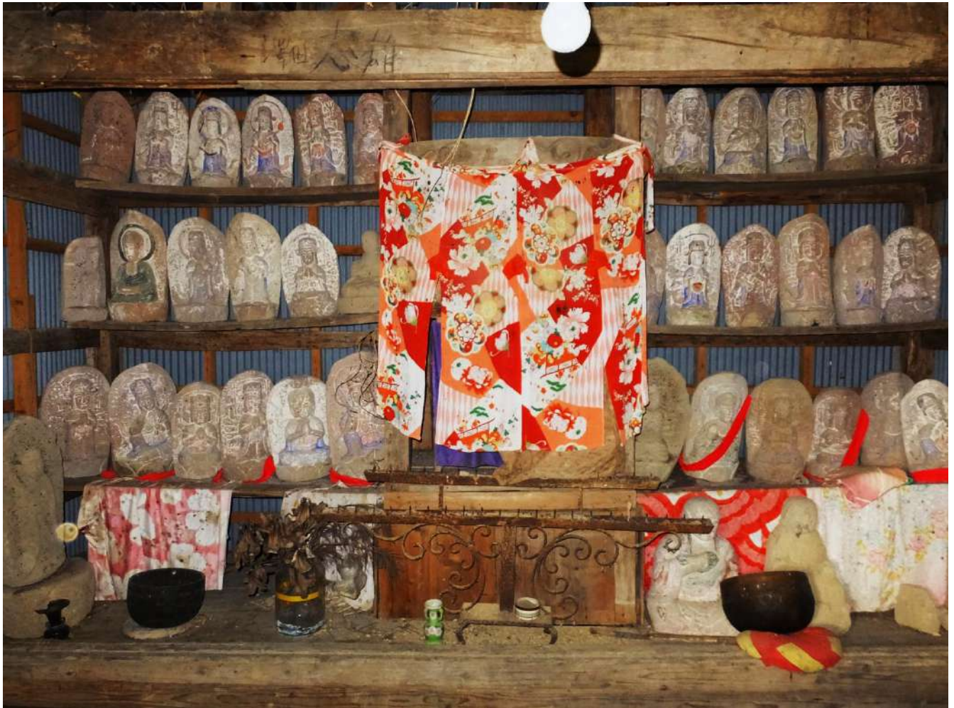
笠破観音堂の石仏