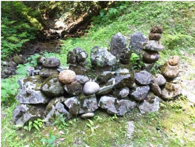
小川寺日尾神明社の中世石造物群