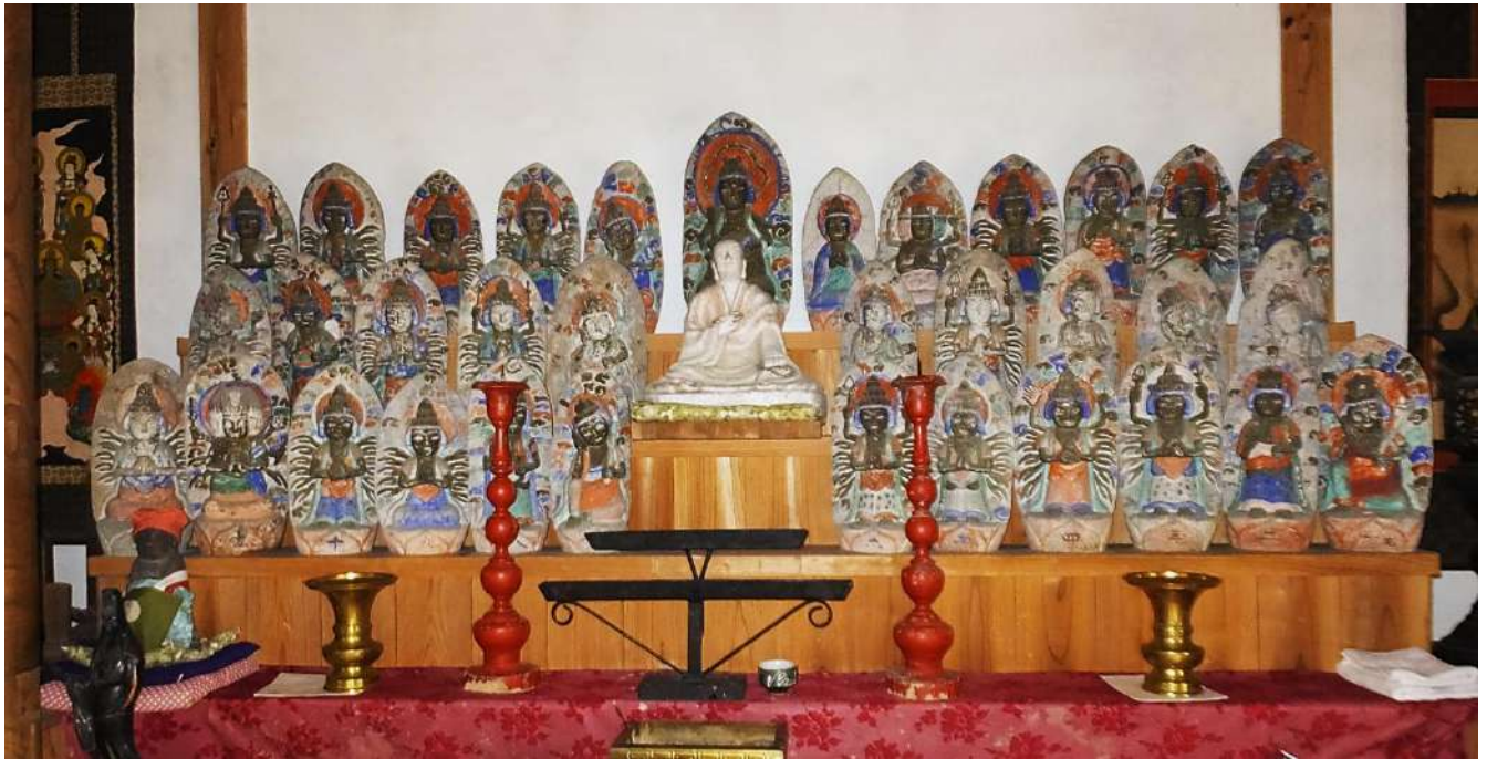
長引野観音堂の石仏