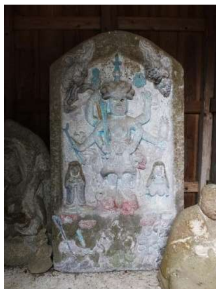
田糶庚申堂の青面金剛