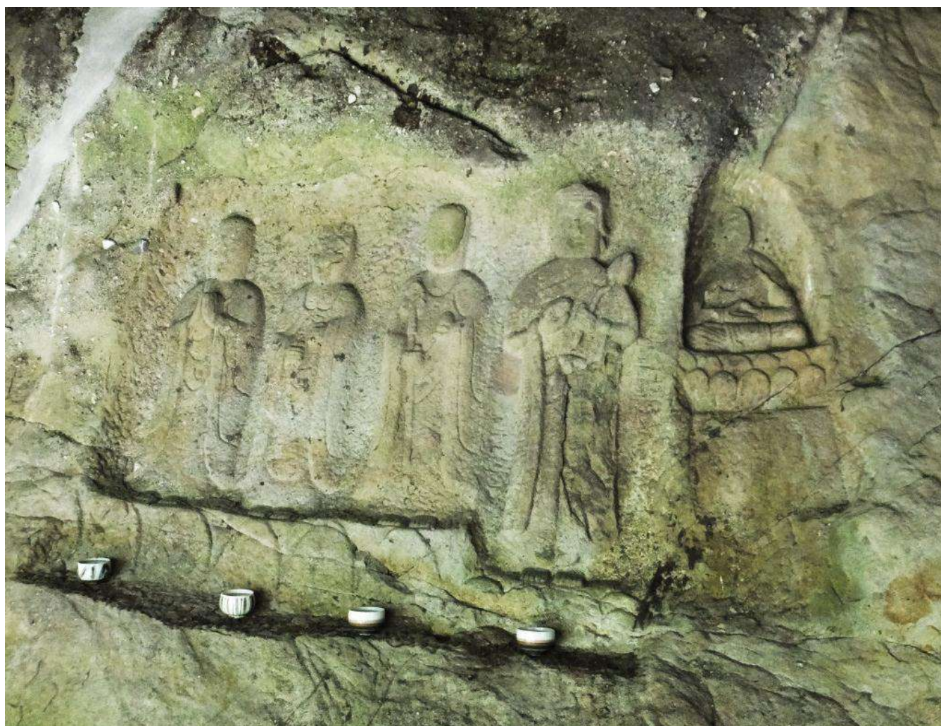
黒部市嘉例沢の磨崖仏