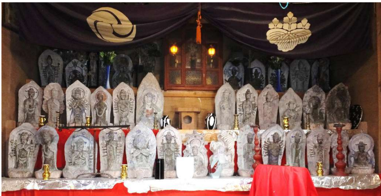
田糶観音堂の石仏