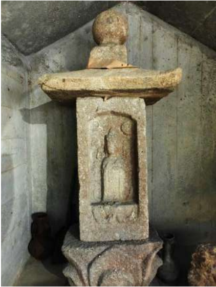
中陣路傍の千手観音