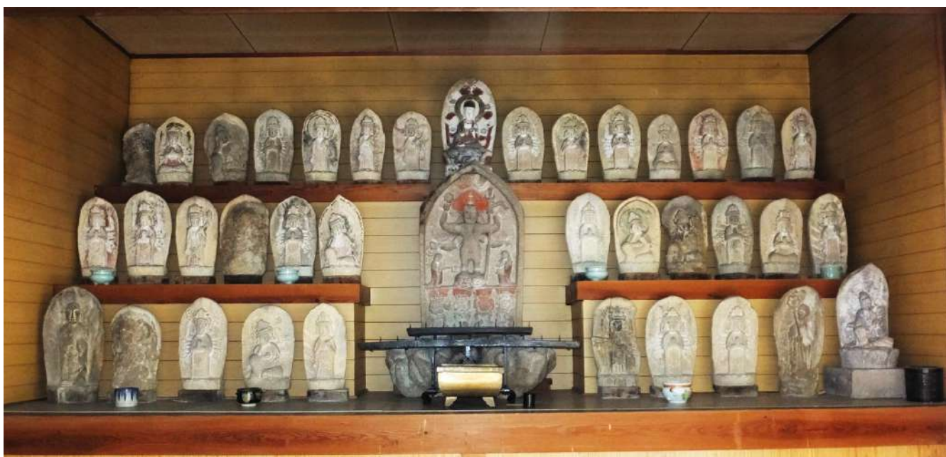
布施爪観音堂の石仏