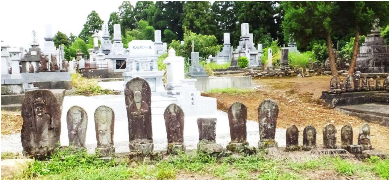
小川寺共同墓地の石仏