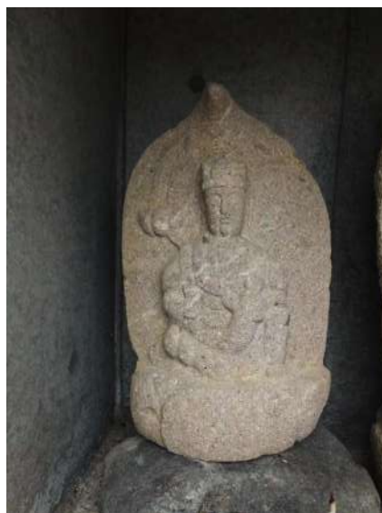
釈迦堂路傍の子供を抱く観音