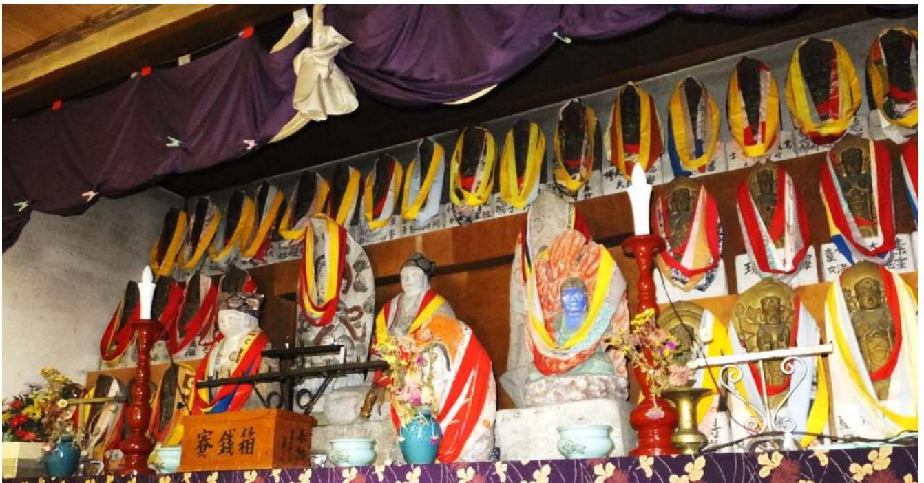
魚津市釈迦堂観音堂の石仏

心蓮坊の檀家が多い地区。神明社裏手に観音堂が建てられており、石造の西国三十三ヶ所観音、文殊菩薩、如意輪観音、不動明王2体、弘法大師2体が納められている。堂内に、十三仏、弘法大師四国八十八ヶ所霊場本尊、弘法大師修行像2幅の掛軸が掲げられている。