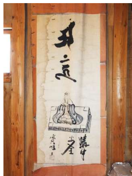
田糶観音堂の二十三日講掛軸