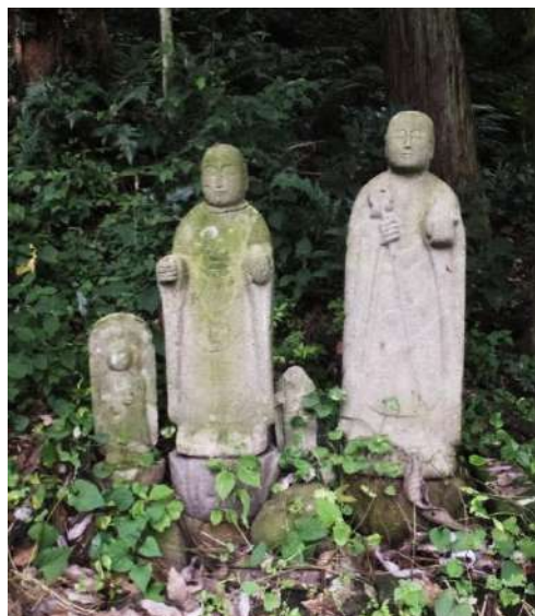
小川寺集落外れの夜泣き地蔵