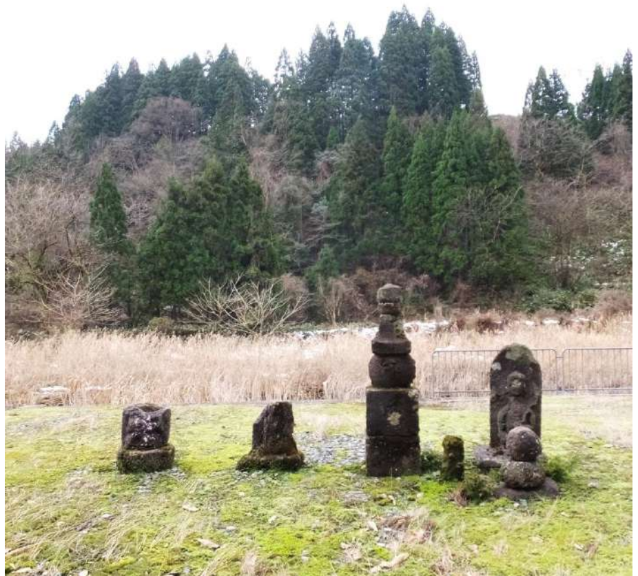
笠破路傍の五輪塔と石仏