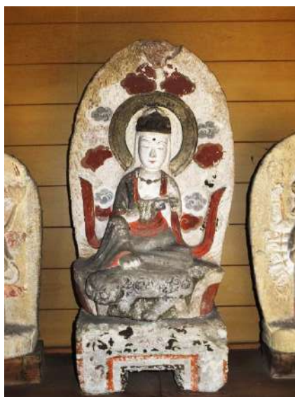
布施爪観音堂の文殊菩薩