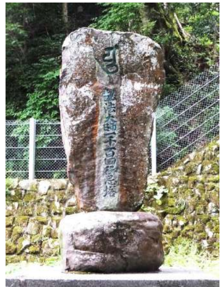
千光寺観音堂右手 「ユ・弘法大師一千百回御忌塔」