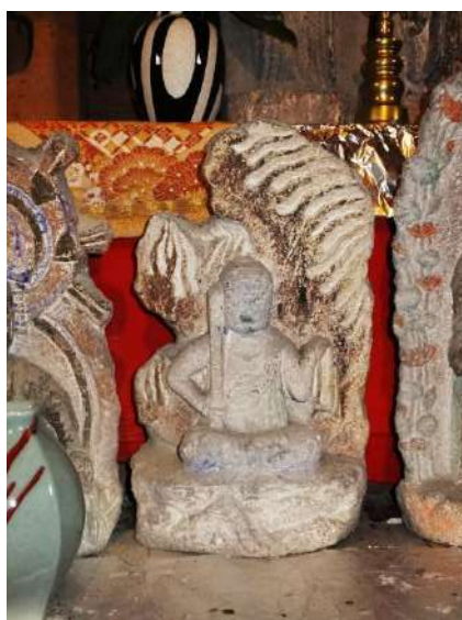
田糶観音堂の不動明王