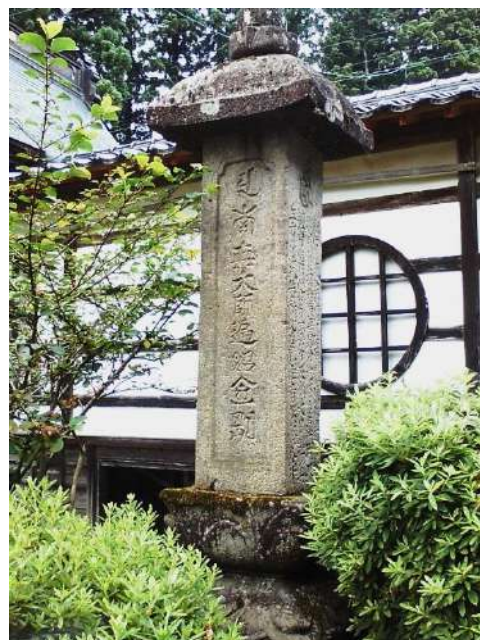
光学坊境内の「ユ・南無大師遍照金剛」