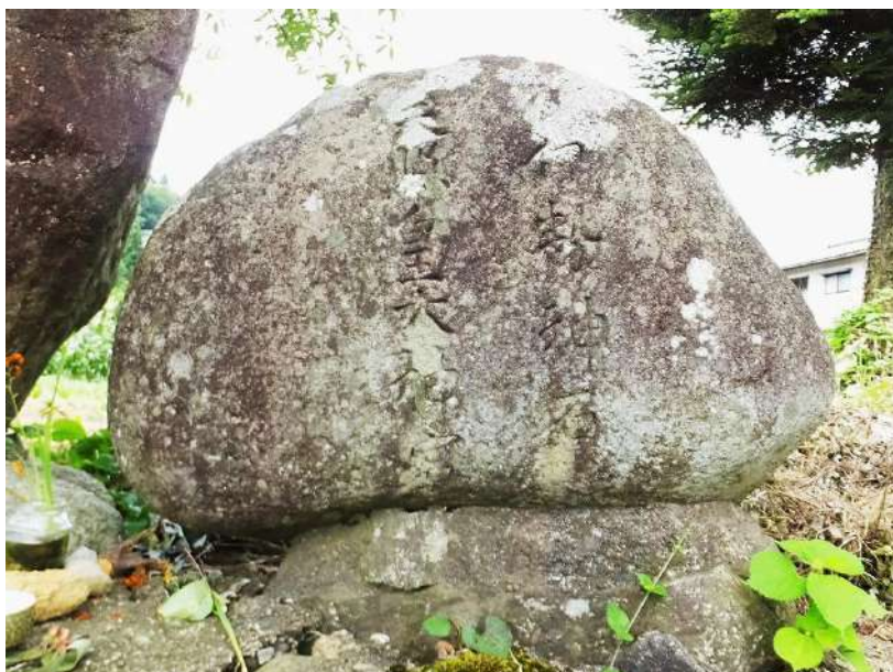
天神山麓の「伊勢神石／天照皇大神宮」