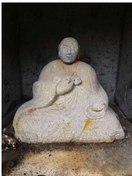
福平集落入り口の弘法大師