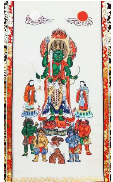
尾山の青面金剛絵像 尾山庚申講の掛軸。平成2年に新調されたもの。もとの古い掛軸は、心蓮坊本堂に掲げられている。