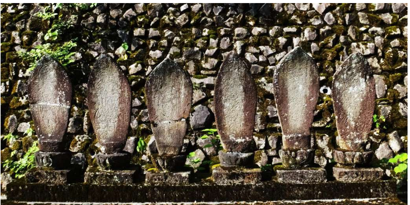
千光寺観音堂裏の線刻六地藏