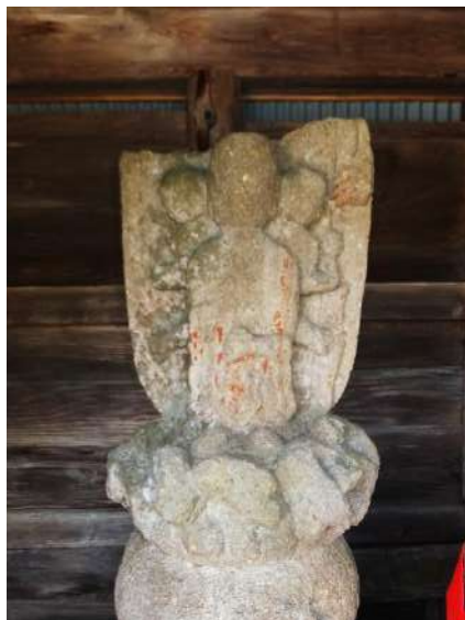
池尻庚申堂の3面6臂青面金剛