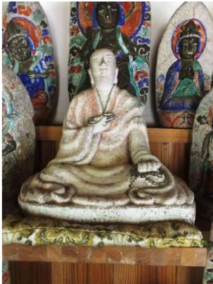
長引野観音堂の弘法大師