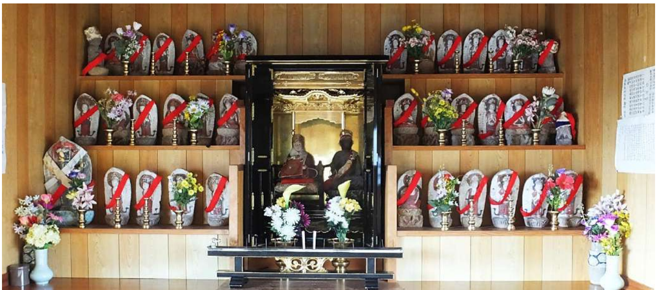
釈迦堂観音堂の木造弘法大師と石仏