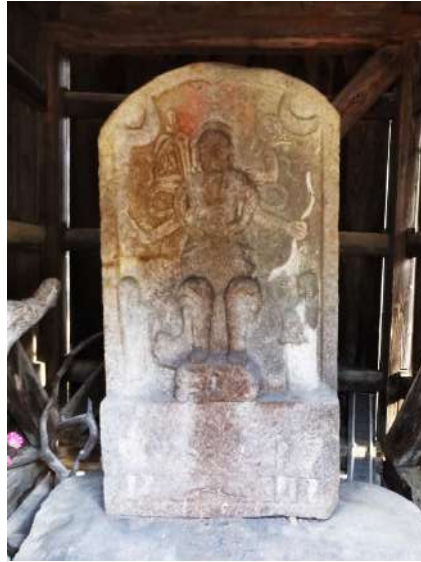
朴谷庚申堂の青面金剛