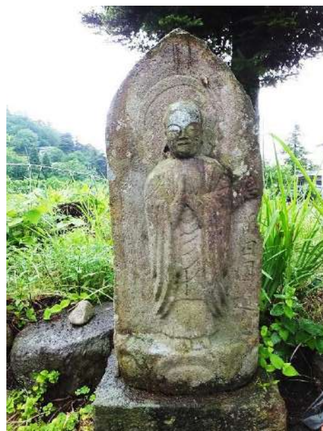
天神山麓の道標地藏