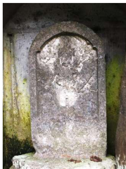
福平路傍の青面金剛