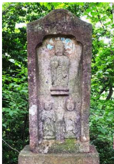
天神山の善光寺式阿弥陀三尊