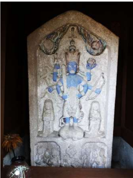
千光寺観音堂石段左の庚申堂 青面金剛