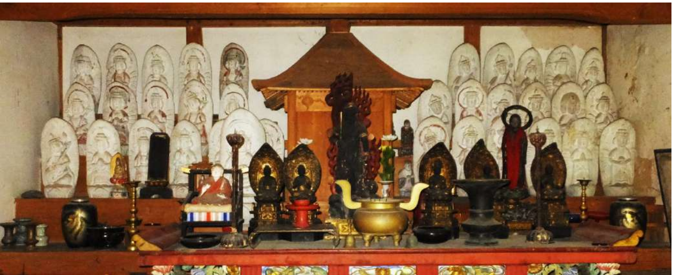
魚津市東尾崎教宝院観音堂の石仏

八幡社参道に観音堂が建てられており、石造の西国三十三ヶ所観音と文殊菩薩が納められている。