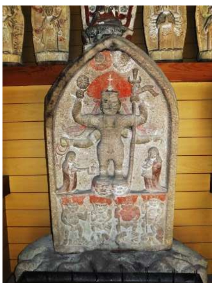
布施爪観音堂の青面金剛