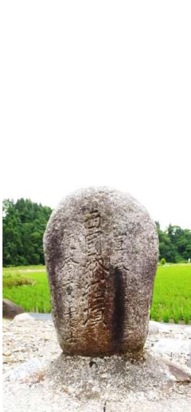
笠破路傍の「西國納経墳」