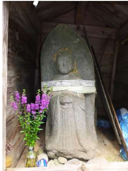
嘉例沢集落北端のサイノカミ地蔵