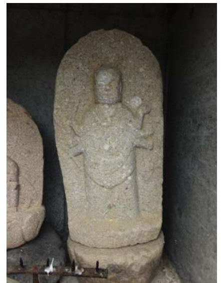
釈迦堂路傍の青面金剛