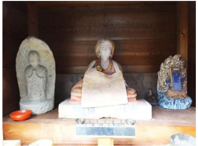
小川寺千光寺観音堂石段右の石仏