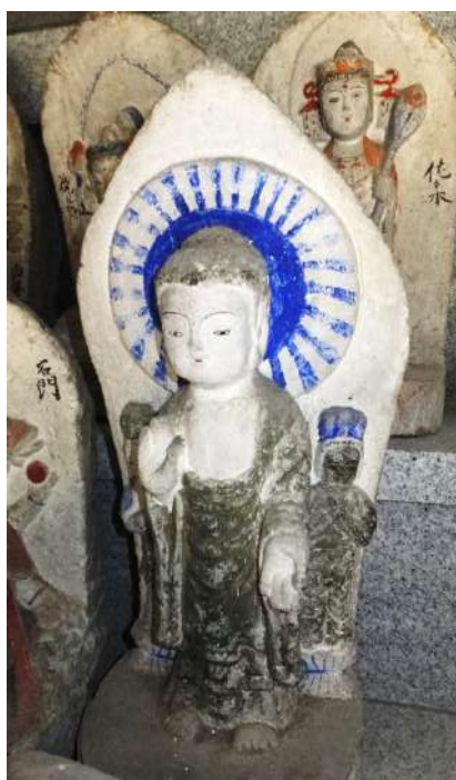
嘉例沢観音堂の善光寺式阿弥陀三尊