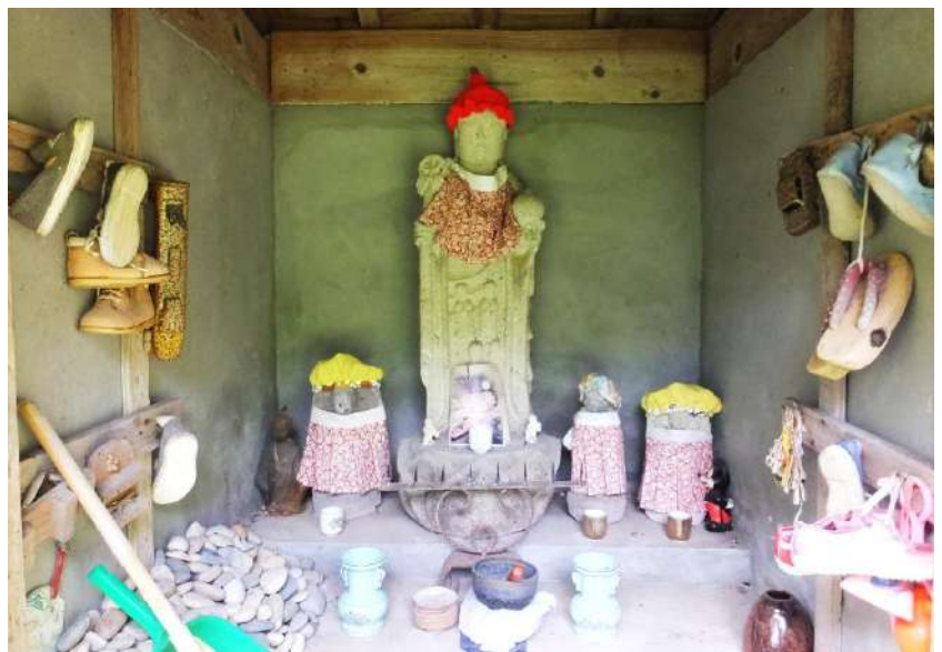
小川寺集落外れの西院河原地蔵(賽の河原地蔵)