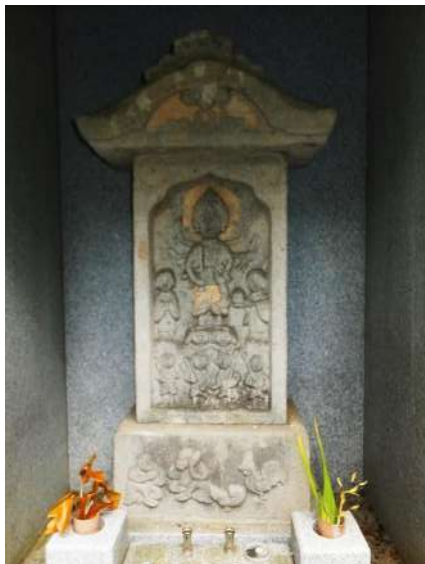
嘉例沢庚申堂の青面金剛