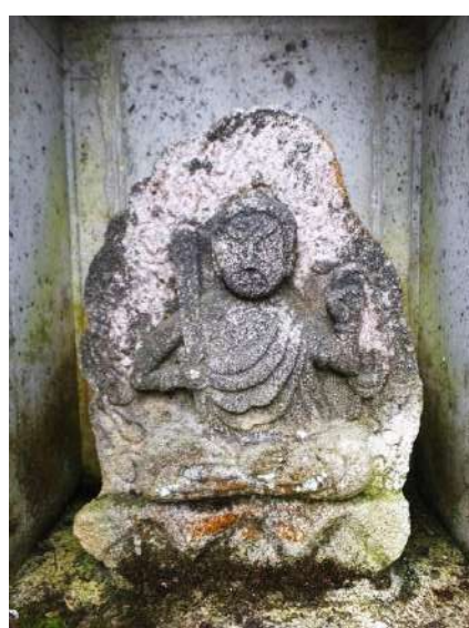
福平路傍の不動明王