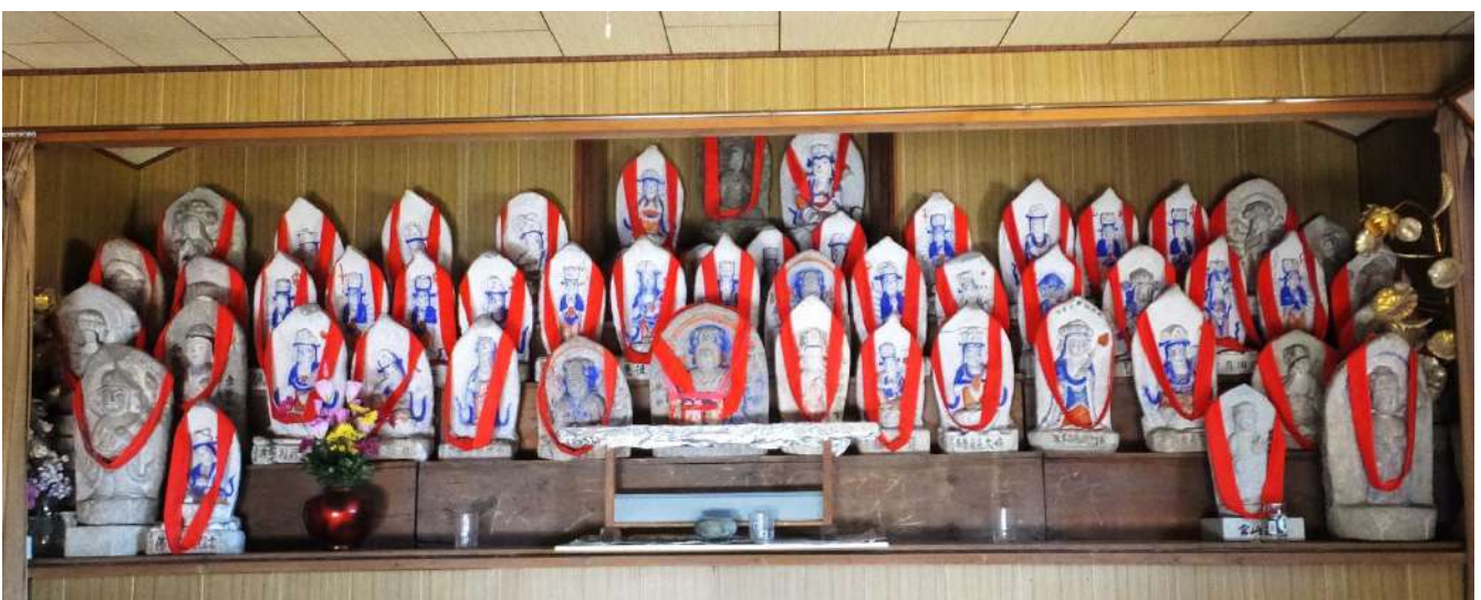
黒部市新町(旧石田新)観音堂の石仏

高野山真言宗教宝院は廃寺となり、本堂内の木造仏は光学坊へ移された。境内には観音堂が残されており、石造の西国三十三ヶ所観音と文殊菩薩などが納められている。中央の厨子内は、木造の如意輪観音。