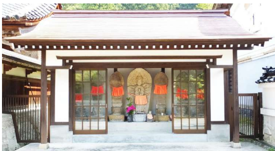
小川寺心蓮坊山門右の十一面千手観音と線刻六観音