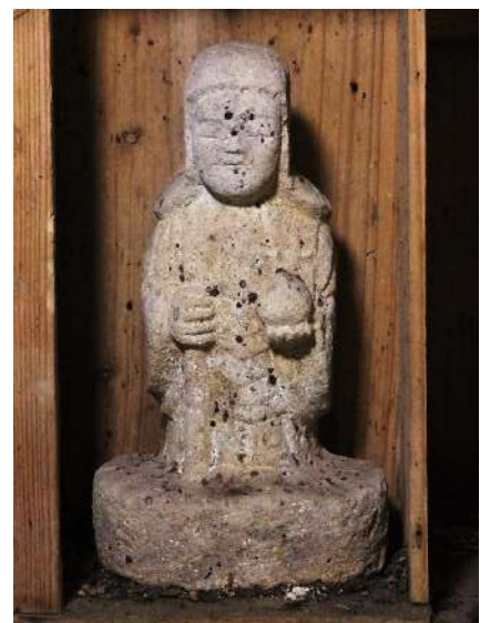
大沢水神社の罔象女命