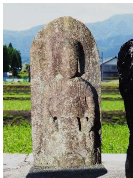
布施爪路傍の虚空蔵菩薩