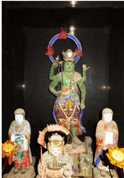
小川寺の木造青面金剛 心蓮坊本堂に納められている1面4臂像。2童子を従えている。