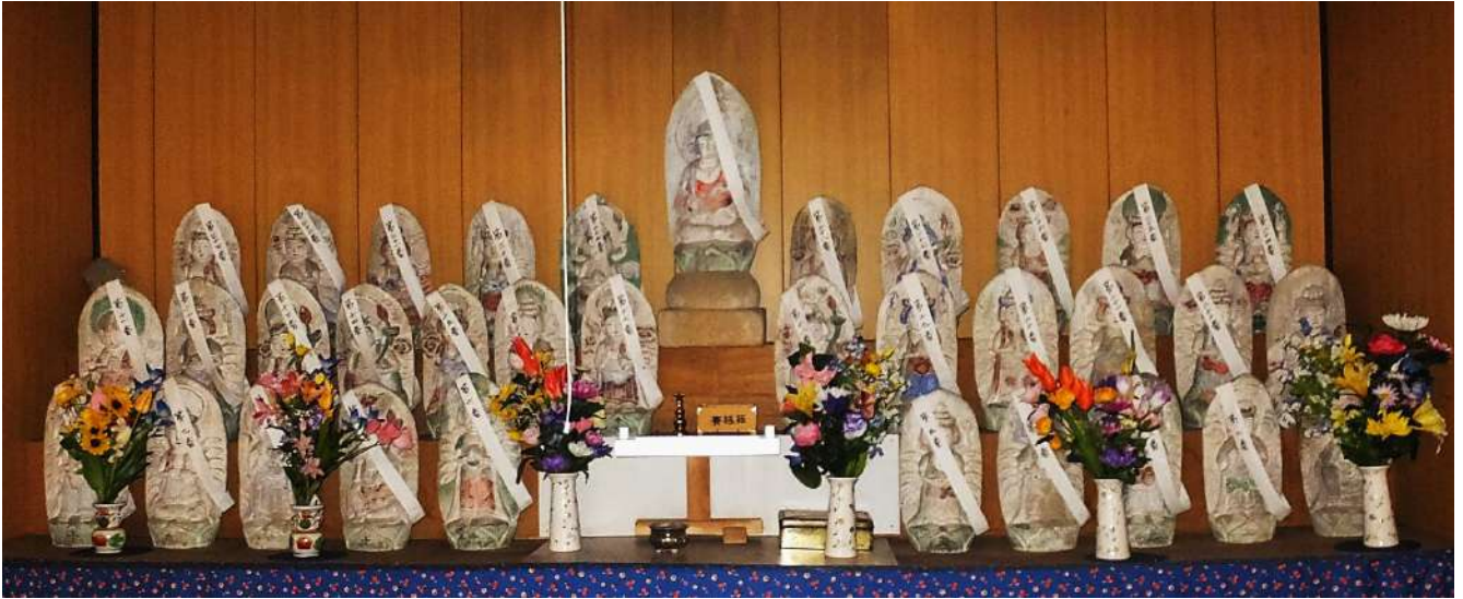
魚津市天神野新観音堂の石仏

八幡社参道に観音堂が建てられており、石造の西国三十三ヶ所観音と文殊菩薩が納められている。