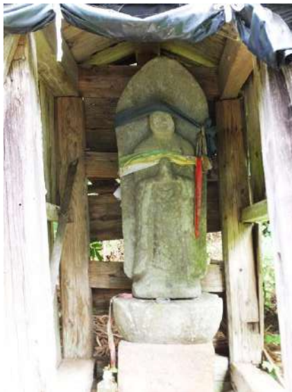
嘉例沢集落南端のサイノカミ地蔵