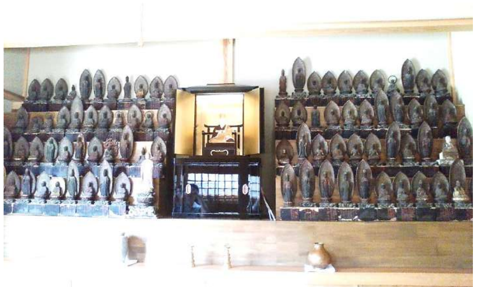
尾山谷川家観音堂の木造弘法大師と四国八十八ヶ所霊場本尊