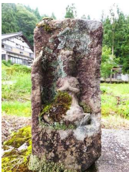
田糶路傍のサンニャ様(勢至菩薩)