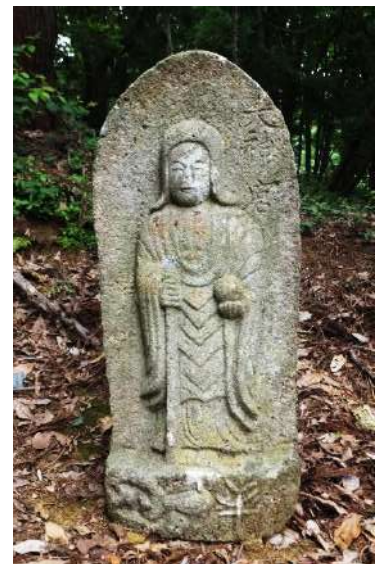
天神山の雨宝童子