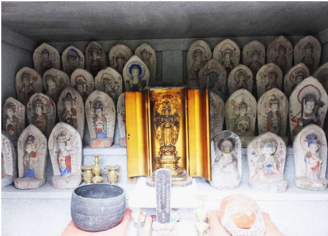
嘉例沢観音堂の木造十一面千手観音と石仏