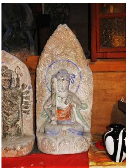
田糶観音堂の文殊菩薩