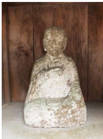
田糶路傍の弘法大師