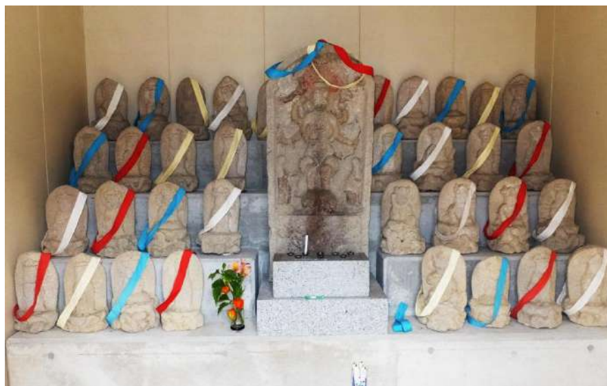
黒沢観音堂の石仏