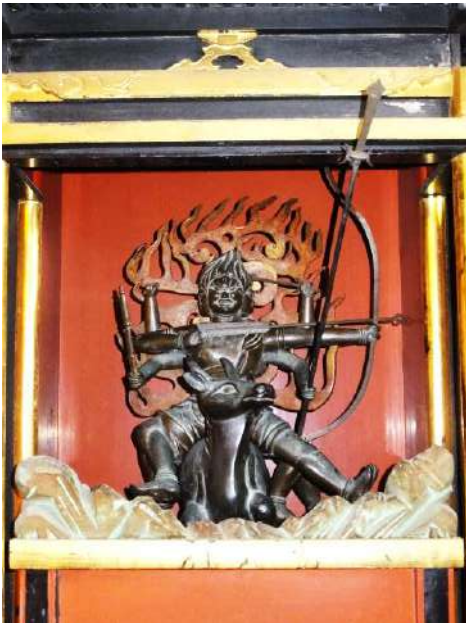
僧ヶ岳の木造大威徳明王 僧ヶ岳仏平にある千光寺奥の院の本尊。冬季は麓に降ろされている。法要時に開扉される。